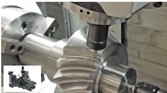
実機でのテストカット